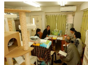
プロボノワーカーが「はちねこ！カフェ」に出向きキックオフを行いました