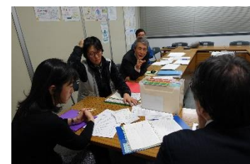
夜遅くまで熱心な議論がなされたヒヤリングの様子です