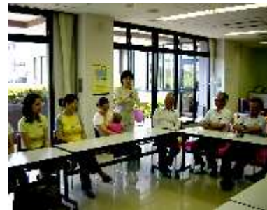
(じいじとばあばの孫育て)

子育ては本来楽しいもの。しかし、今、子育てストレスにさいなまされている親が急増しています。「群れ遊びの場がない」など、昔とはまるで環境が変わってきているのです。子育てしやすい環境を