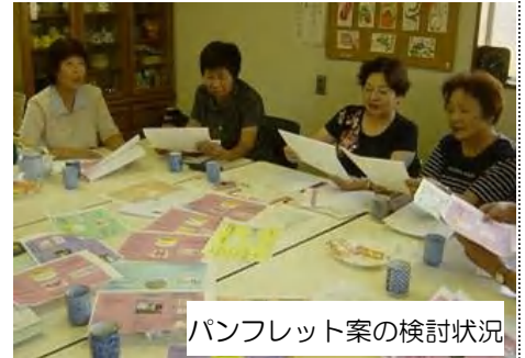
パンフレット案の検討状況