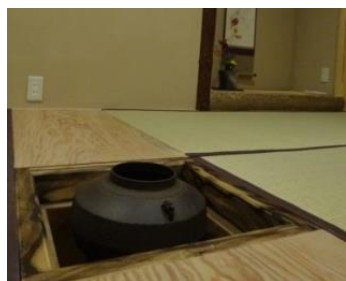
店舗裏手にある茶室。「ここでは定期的に茶道教室が開かれています。通ってくる女性は着物を着たり、非日常を味わうことを楽しみにしています。子育て中のママに茶道は無理でも、ダットッチで自分を取り戻す時間を見つけて欲しいです」