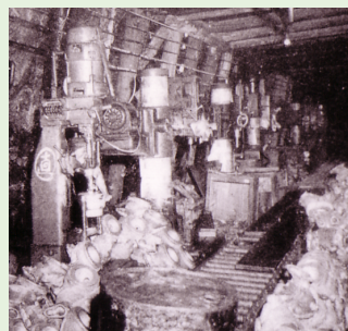
アメリカ戦略爆撃調査団の報告書掲載写真(1945年撮影)