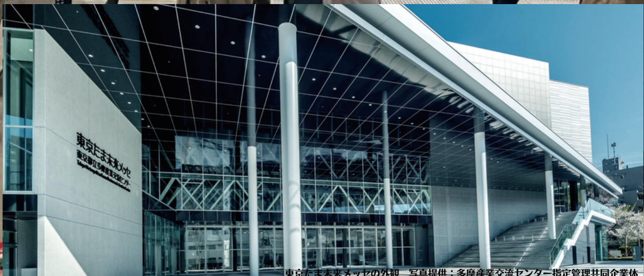
東京たま未来メッセの外観